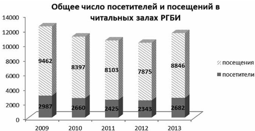
Диаграмма читательской активности 2009–2013 гг. отражает число читателей и посещений.

В цифровом выражении возобновление читательского интереса выглядит следующим образом.