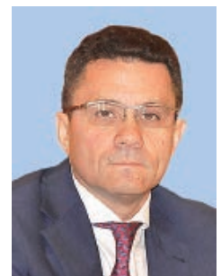
Вадим ДУДА, Генеральный директор Российской государственной библиотеки (РГБ)